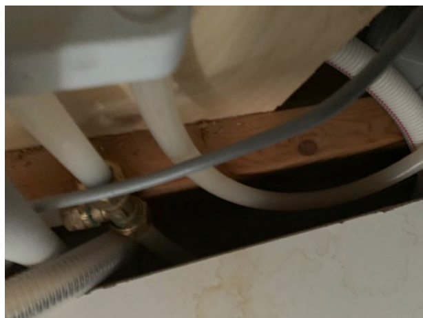
Spilltråg saknas i diskbänkskåp