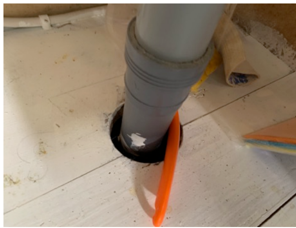
Ej fuksäker botten i diskbänkskåp