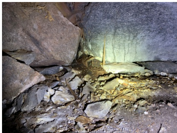
Fuktinträngning i grund vid gavel