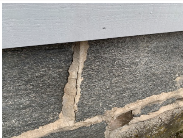
Sprickor i mellangjutningar i grund