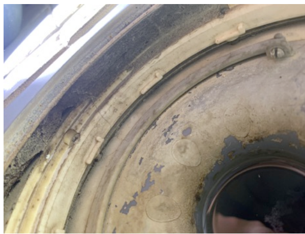
Brunnsmanschett synlig under klämring i golvbrunn