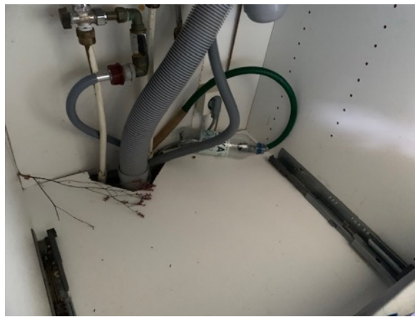
Ej fuktsäker botten i diskbänkskåp