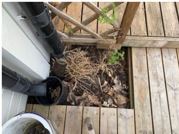
Växt invid hus och stuprör från förråd leder ej ner i markledning