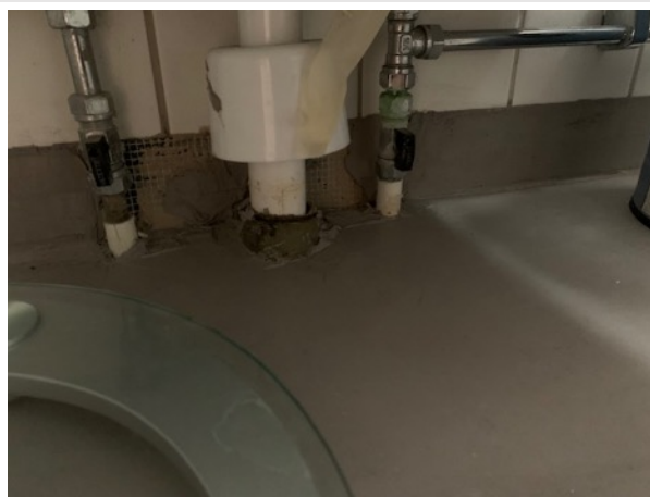
Trycksatta rörgenomföringar i golv och avlopp nära vägg