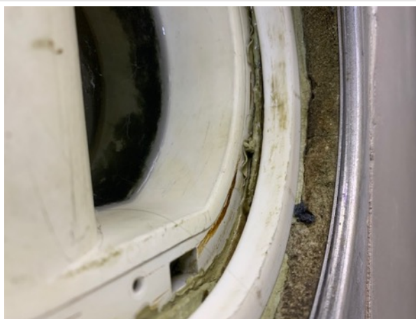
Brunnsmanschett synlig under klämring i golvbrunn och klämring sitter löst