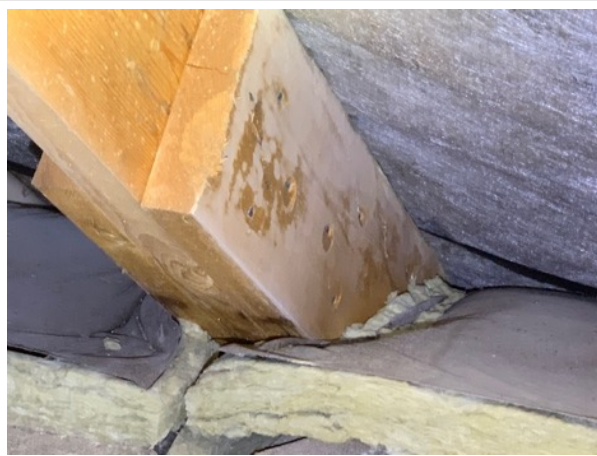
Mikrobiellpåväxt/missfärgningar på takstol på vind